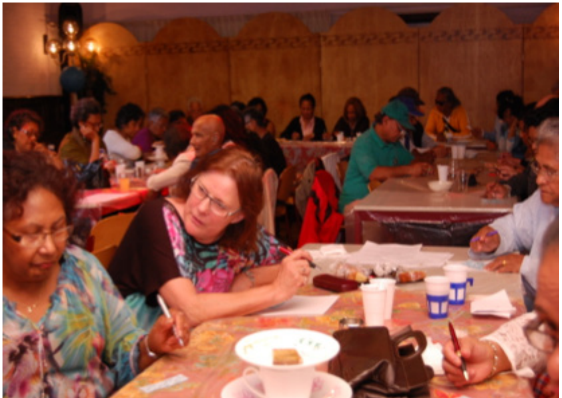
Inzameling Premieplan Gennep, mei 2014