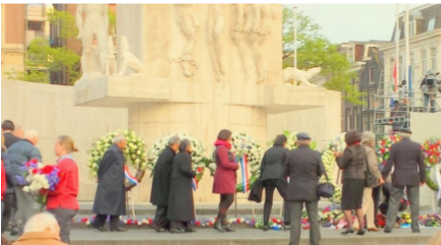
Bloemen leggen bij het Nationaal Monument op de Dam.

Met het bijwonen van de Nationale Herdenking op 4 mei door Molukse ouderen is een aanvang gemaakt in 2011, op verzoek van Stichting Pelita aan Comité 4 en 5 mei. In samenwerking met LSMO werd in dat jaar voor het eerst de Herdenking bijgewoond. (uit Nieuwsbrief Stg. MHM mei 2014-06-20)