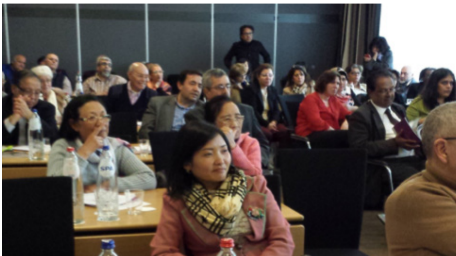
Voorlichting vroegsignalering mogelijke zorg- fraude, 16 april, Nieuwegein.

Voor oneigenlijk gebruik hanteert het ministerie van VWS als definitie: "Oneigenlijk gebruik betreft het handelen binnen wet- en regelgeving maar niet in lijn met de doelstelling van wet- en regelgeving (handelen naar de letter van de wet, maar niet naar de geest van de wet)." Met andere woorden: Er zijn geen regels overtreden, maar wat er gebeurd is, is overduidelijk niet volgens de bedoeling van de wet of regels.