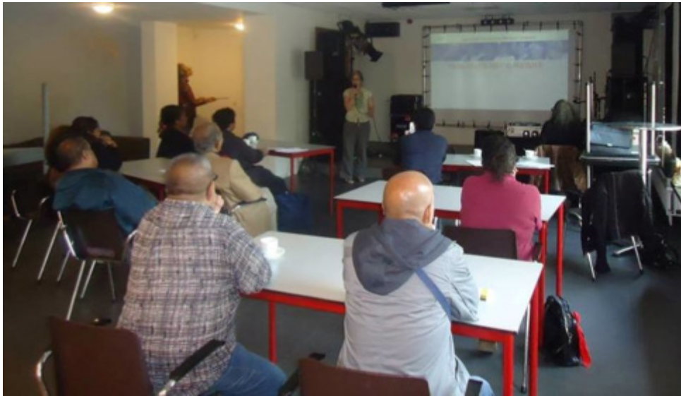
Voorlichting Nistelrode, 5 juni 2014.