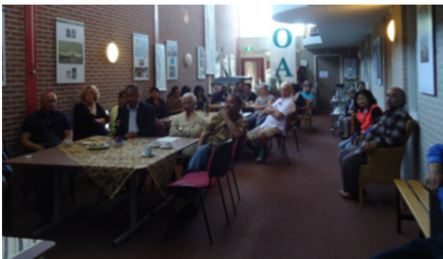
Voorlichting Tabadila in Middelburg, 17 mei 2014.

In de vorige nieuwsbrief heeft u kunnen lezen waar LSMO voorlichting heeft gegeven over verschillende thema's. Onderwerpen als dementie, informatie over de ziekte en de zorg die het met zich meebrengt, hoe we voor elkaar klaar willen staan, in hoeverre dit nog vanzelfsprekend is en waar u zich zorgen over maakt, zijn besproken. Op 2 mei waren we in Capelle aan den IJssel waar de voorlichtingsavond werd afgesloten met een gezellig programma, geheel verzorgd door jongeren. Voorlichting over Ouderen in Veilige handen werd op 17 mei ook in Middelburg gegeven. Na een plenaire sessie werd in groepen besproken wat en wie er nodig is om te komen tot een goed functionerend vangnet in de Molukse Zeeuwse samenleving. Net als in Middelburg werd ook in Nistelrode de film 'Leven met Alzheimer' getoond. Aan de hand van de film werd eveneens gesproken over hoe men kan zorgen voor een 'veilige omgeving' voor ouderen en mantelzorgers. Gebleken is dat deze film, evenals de film 'Wie zorgt er later voor mij', waarin getoond wordt hoe Molukse ouderen oud willen worden, goede instrumenten zijn om verschillende onderwerpen te bespreken. Het is nog steeds mogelijk om samen met u een dergelijke voorlichtingsbijeenkomst te organiseren.