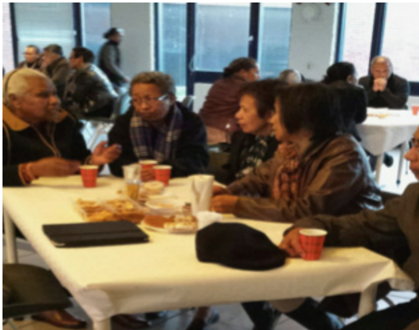
In gesprek in Capelle over de gevolgen van de veranderingen in de zorg, 2 mei 2014.

De negen prestatievelden komen in het nieuwe wetsvoorstel niet meer voor. In de omschrijving van het begrip maatschappelijke ondersteuning, zijn de prestatievelden voor een deel wel te herkennen. Het begrip geeft aan waar de gemeente zich mee bezig dient te houden en omvat: